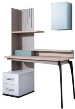
Çalışma Masası / Workstation W/G: 132 H/Y: 173 D/D: 59