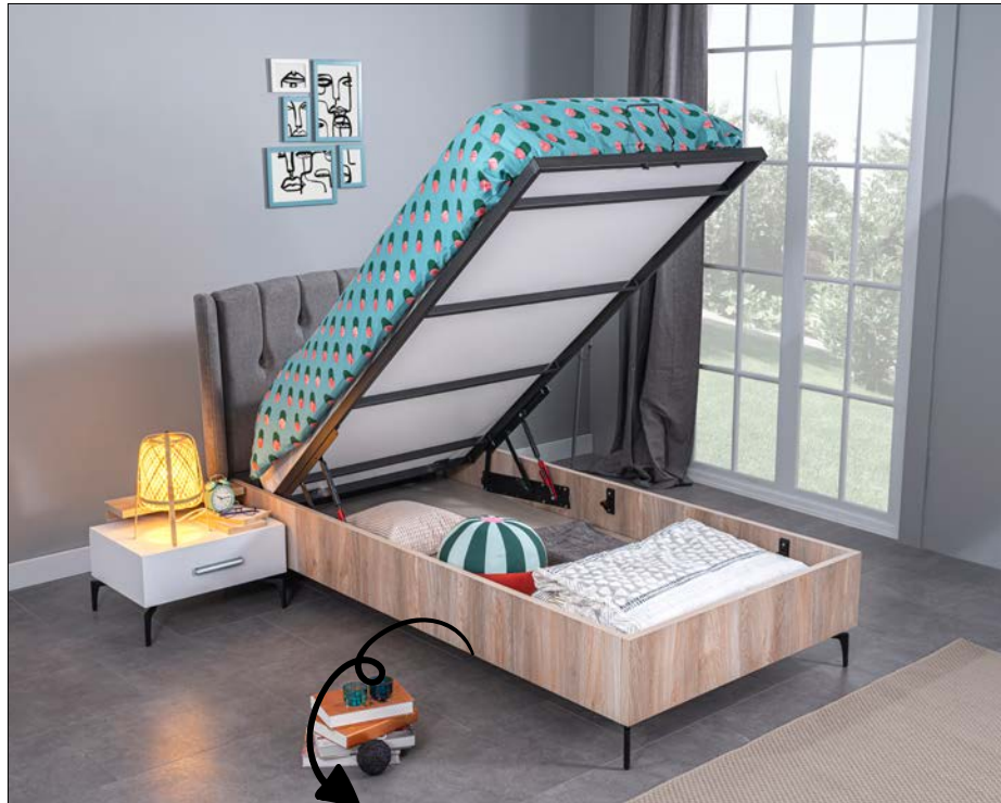
2 adet mukavemetli amortisör, 2 adet galvaniz makas ve 2 adet emniyet kilidi (stoplama sistemi) bulunmaktadır.