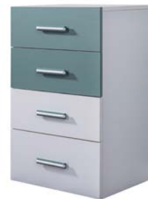
Çamaşılık / Chest Of Drawer W/G: 56 H/Y: 90 D/D: 45