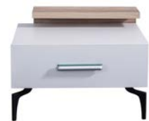
Komidin / Bedside Table W/G: 56 H/Y: 40 D/D: 48