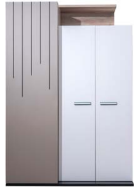
Dolap / Wardrobe W/G: 136 H/Y:199 D/D: 63

Başlık döşemesinde kullanılan kumaşın silinebilirlik özelliği yanında uygulama form şekli tüketicilere estetik bir sunum sağlıyor.