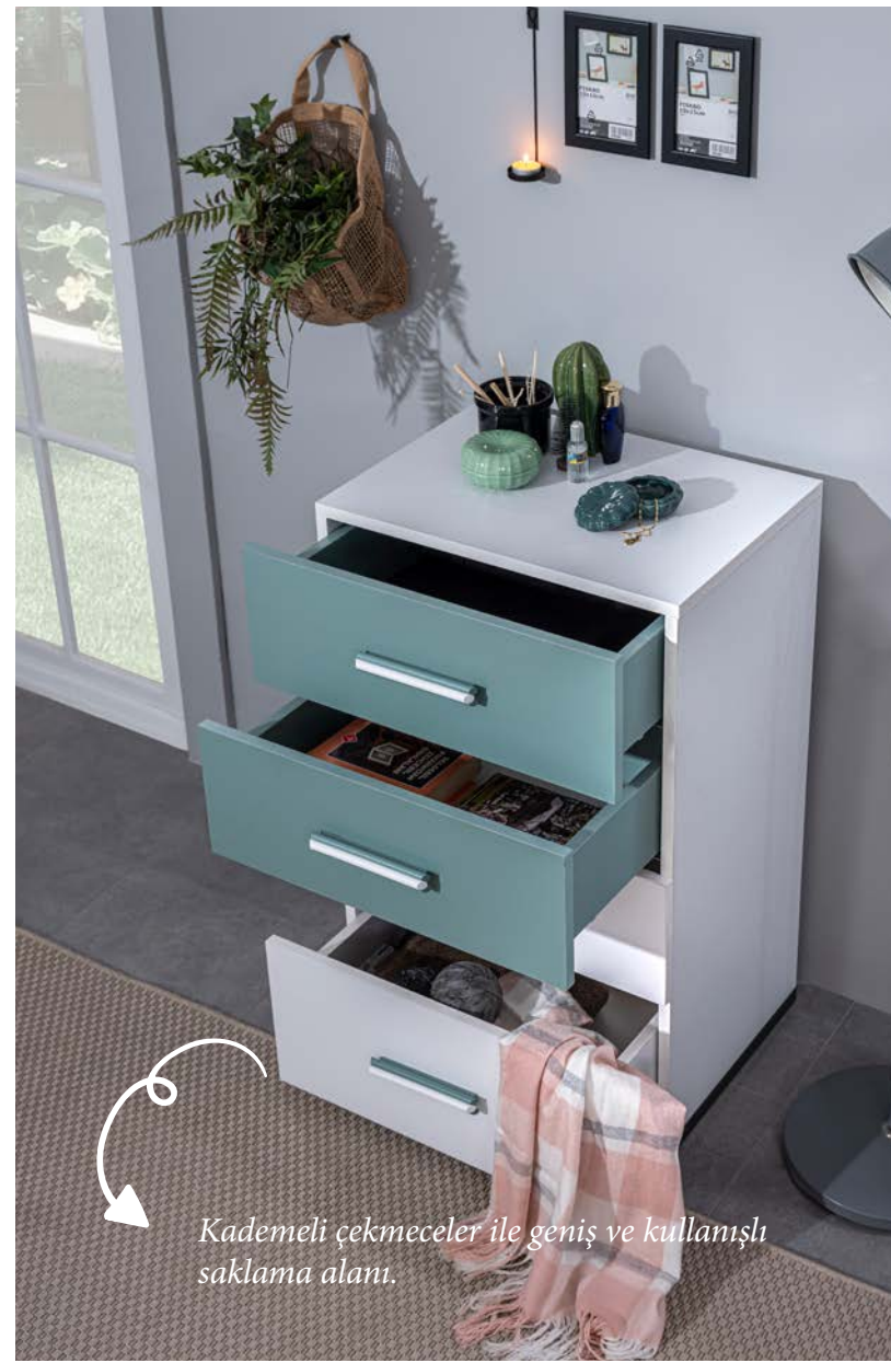
Kademeli çekmeceler ile geniş ve kullanışlı saklama alanı.