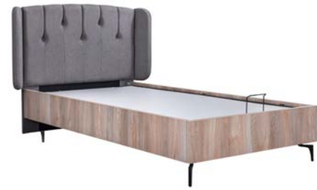
100'Lük Bazalı Karyola / Storage Bed W/G: 131 H/Y: 114 D/D: 215 120'Lik Bazalı Karyola / Storage Bed W/G: 131 H/Y: 114 D/D: 215